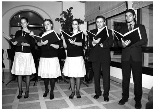
Tradiční Vánoční koncert pořádaný Novou vlastí za podpory českého velvyslanectví ve Vídni v Mramorovém sále českého velvyslanectví